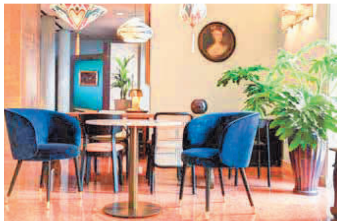
Indigo Verona Grand Hotel des Arts L'albergo riapre in una veste rinnovata e di gran fascino grazie ad un attento e dettagliato studio curato da THDP.